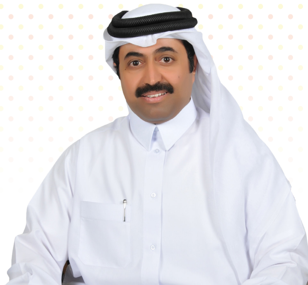
الدكتور / محمد بن صالح السادة وزير الطاقة والصناعة رئيس مجلس الإدارة

إنه من دواعي سروري أن أرحب بكم جميعاً في الاجتماع الأول للجمعية العمومية لشركة مسيعيد للبتروكيماويات القابضة، إحدى الشركات الرائدة في المنطقة لإنتاج البتروكيماويات المتنوعة. لقد مثل الطرح العام الأولي لشركة مسيعيد للبتروكيماويات القابضة علامة فارقة لبداية عهد جديد لصناعة الكيماويات والبتروكيماويات في دولة قطر، خاصة إذا ما أخذنا بعين الاعتبار مزاياها وقدراتها التنافسية.