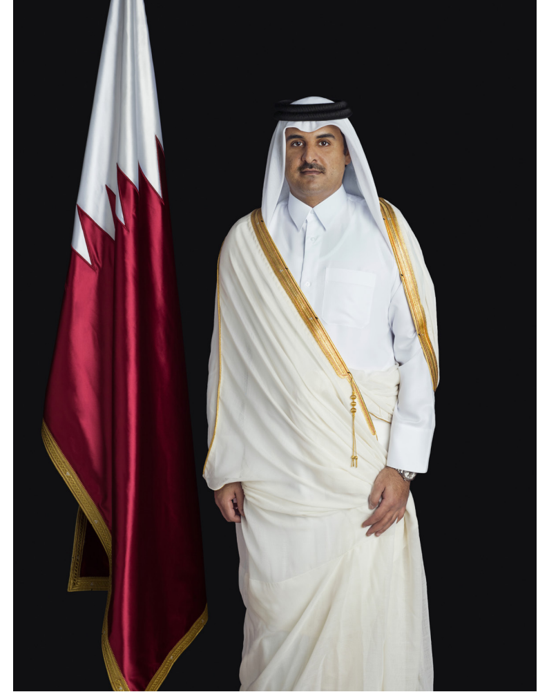
حضرة صاحب السمو الشيخ/ تميم بن حمد آل ثاني أمير دولة قطر