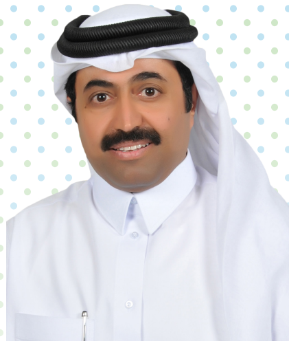
سعادة الدكتور / محمد بن صالح السادة وزير الطاقة والصناعة رئيس مجلس الإدارة